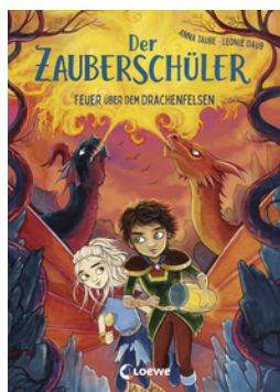
Der Zauberschüler (Band 6) - Feuer über dem Drachenfelsen