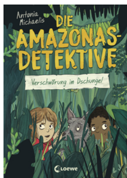
Die Amazonas-Detektive (Band 1) - Verschwörung im Dschungel