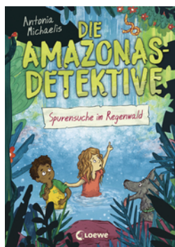
Die Amazonas-Detektive (Band 3) - Spurensuche im Regenwald