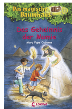
Das magische Baumhaus (Band 3) - Das Geheimnis der Mumie