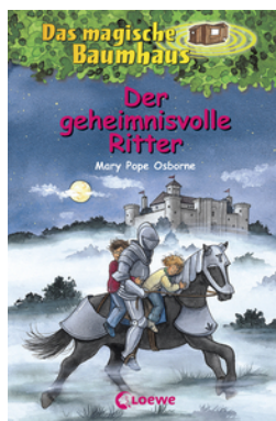
Das magische Baumhaus (Band 2) - Der geheimnisvolle Ritter