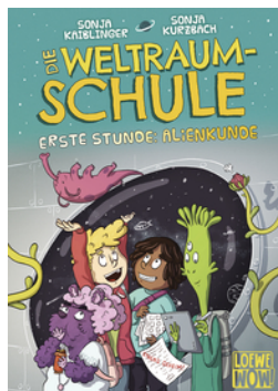
Die Weltraumschule (Band 1) - Erste Stunde: Alienkunde