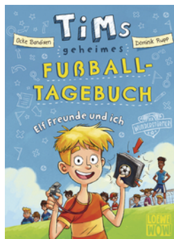
Tims geheimes Fußball- Tagebuch (Band 1) - Elf Freunde und ich!