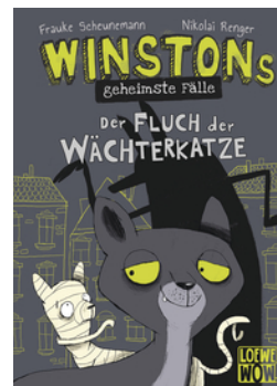
Winstons geheimste Fälle (Band 1) - Der Fluch der Wächterkatze