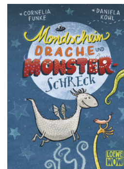
Mondscheindrache und Monsterschreck