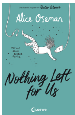
Nothing Left for Us (deutsche Ausgabe von Radio Silence)