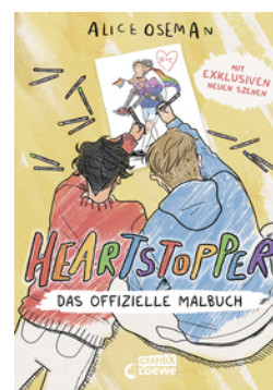
Heartstopper - Das offizielle Malbuch