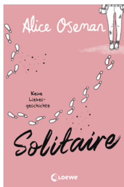
Solitaire (deutsche Ausgabe)