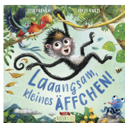
Laaangsam, kleines Äffchen!