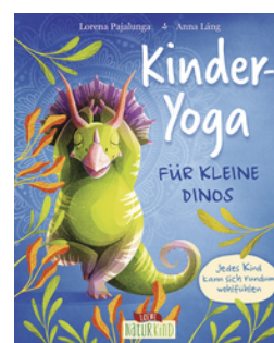
Kinder-Yoga für kleine Dinos