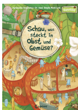
Schau, was steckt in Obst und Gemüse?