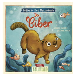
Mein erstes Naturbuch - Der Biber