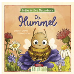
Mein erstes Naturbuch - Die Hummel