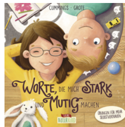
Worte, die mich stark und mutig machen