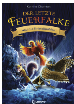
Der letzte Feuerfalke und die Kristallhöhlen (Band 2)