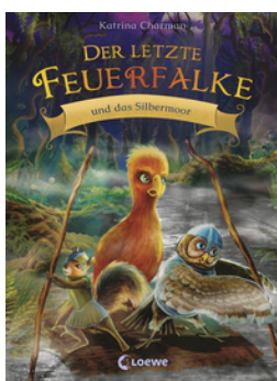
Der letzte Feuerfalke und das Silbermoor (Band 8)