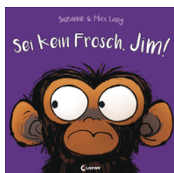
Sei kein Frosch, Jim!