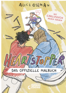
Heartstopper - Das offizielle Malbuch