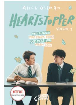
Heartstopper Volume 1