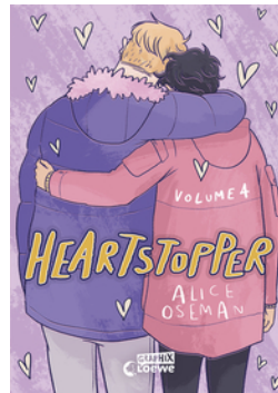
Heartstopper Volume 4 (deutsche Ausgabe)