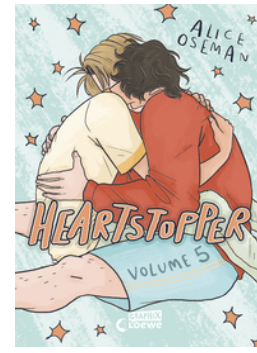
Heartstopper Volume 5 (deutsche Hardcover-Ausgabe)