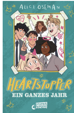
Heartstopper - Ein ganzes Jahr (Yearbook)