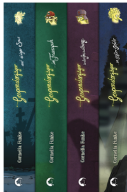
Gespensterjäger - Die komplette Reihe