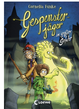
Gespensterjäger in großer Gefahr