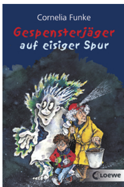
Gespensterjäger auf eisiger Spur