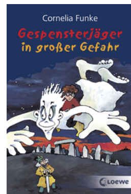
Gespensterjäger in großer Gefahr