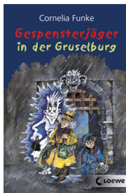
Gespensterjäger in der Gruselburg