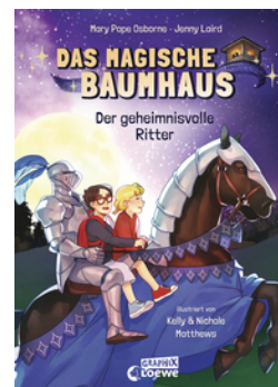
Das magische Baumhaus (Comic-Buchreihe, Band 2) - Der geheimnisvolle Ritter