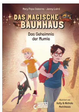
Das magische Baumhaus (Comic-Buchreihe, Band 3) - Das Geheimnis der Mumie