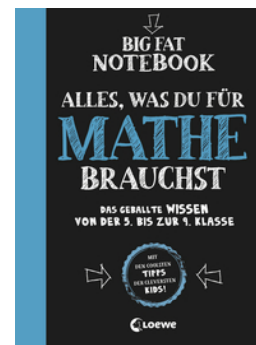
Big Fat Notebook - Alles, was du für Mathe brauchst - Das geballte Wissen von der 5. bis zur 9. Klasse