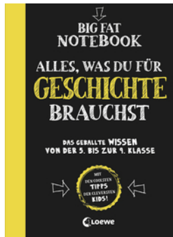
Big Fat Notebook - Alles, was du für Geschichte brauchst