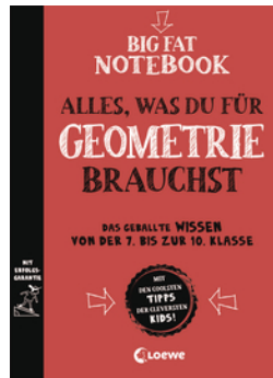
Big Fat Notebook - Alles, was du für Geometrie brauchst