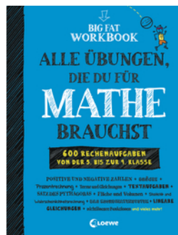
Big Fat Workbook - Alle Übungen, die du für Mathe brauchst