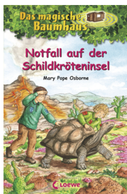
Das magische Baumhaus (Band 62) - Notfall auf der Schildkröteninsel