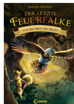
Der letzte Feuerfalke und der Stein der Macht (Band 1)