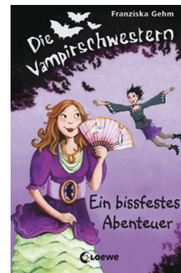
Die Vampirschwestern (Band 2) - Ein bissfestes Abenteuer