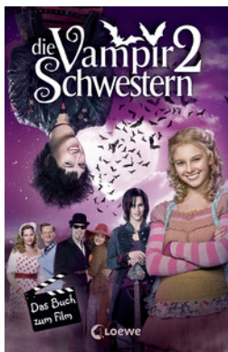
Die Vampirschwestern 2 – Das Buch zum Film