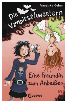
Die Vampirschwestern (Band 1) - Eine Freundin zum Anbeißen