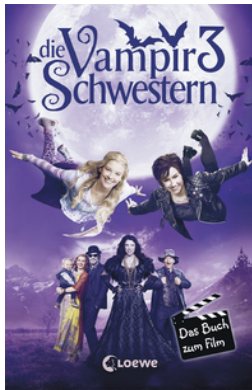
Die Vampirschwestern 3 – Das Buch zum Film