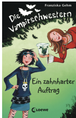
Die Vampirschwestern (Band 3) - Ein zahnharter Auftrag