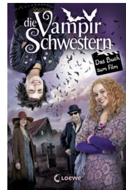
Die Vampirschwestern – Das Buch zum Film