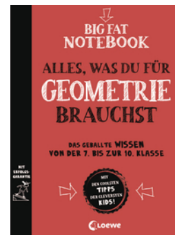
Big Fat Notebook - Alles, was du für Geometrie brauchst