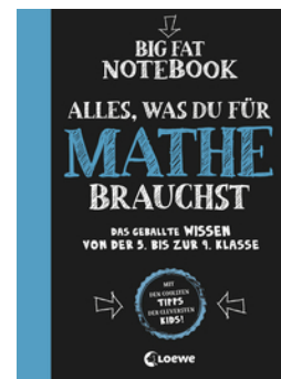
Big Fat Notebook - Alles, was du für Mathe brauchst - Das geballte Wissen von der 5. bis zur 9. Klasse