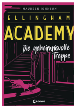
Ellingham Academy (Band 2) - Die geheimnisvolle Treppe