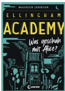
Ellingham Academy (Band 1) - Was geschah mit Alice?