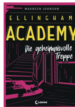
Ellingham Academy (Band 2) - Die geheimnisvolle Treppe