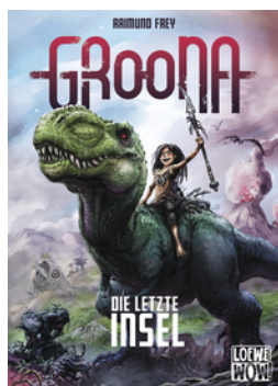
Groona - Die letzte Insel