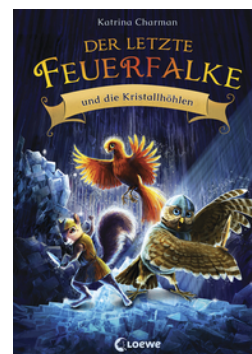
Der letzte Feuerfalk und die Kristallhöhlen (Band 2)