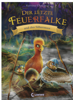
Der letzte Feuerfalke und das Silbermoor (Band 8)