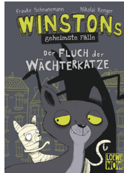
Winstons geheimste Fälle (Band 1) - Der Fluch der Wächterkatze