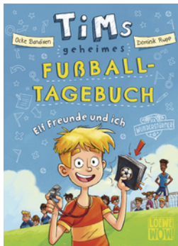
Tims geheimes Fußball- Tagebuch (Band 1) - Elf Freunde und ich!