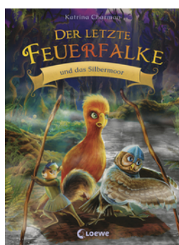
Der letzte Feuerfalk und das Silbermoor (Band 8)