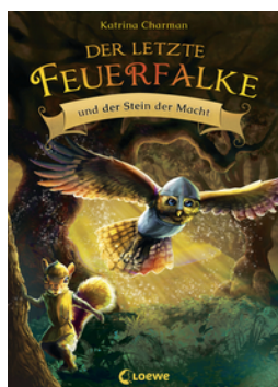
Der letzte Feuerfalk und der Stein der Macht (Band 1)