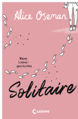
Solitaire (deutsche Ausgabe)