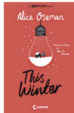
This Winter (deutsche Ausgabe)