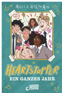
Heartstopper - Ein ganzes Jahr (Yearbook)