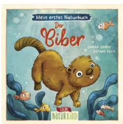
Mein erstes Naturbuch - Der Biber