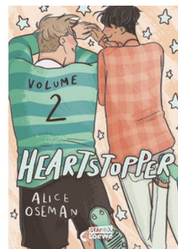
Heartstopper Volume 2 (deutsche Ausgabe)