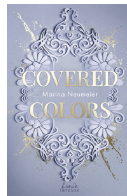
Covered Colors (Golden Hearts, Band 2)