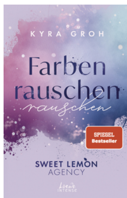
Farben rauschen (Sweet Lemon Agency, Band 2)