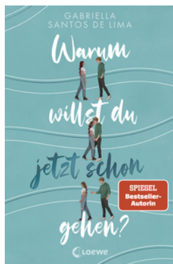
Warum willst du jetzt schon gehen?