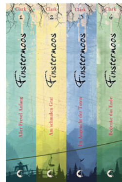
Finstermoos - Die komplette Reihe inkl. eShort