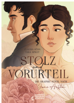
Stolz und Vorurteil