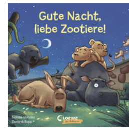
Gute Nacht, liebe Zootiere!