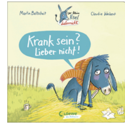
Der kleine Esel Lieber nicht - Krank sein? Lieber nicht!