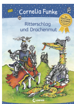
Ritterschlag und Drachenmut