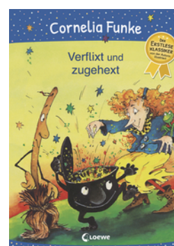
Verflixt und zugehext