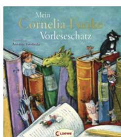
Mein Cornelia-Funke- Vorleseschatz