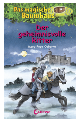
Das magische Baumhaus (Band 2) - Der geheimnisvolle Ritter