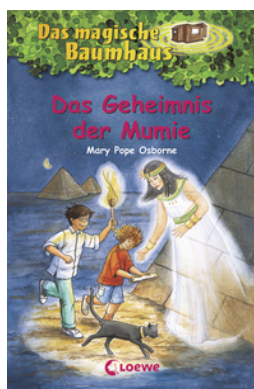
Das magische Baumhaus (Band 3) - Das Geheimnis der Mumie