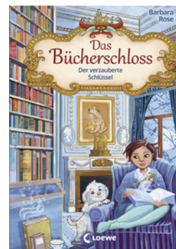
Das Bücherschloss (Band 2) - Der verzauberte Schlüssel