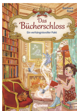
Das Bücherschloss (Band 4) - Ein verhängnisvoller Pakt