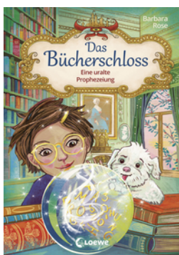
Das Bücherschloss (Band 3) - Eine uralte Prophezeiung