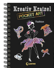
Kreativ-Kratzel Pocket Art: Fashion