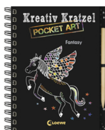
Kreativ-Kratzel Pocket Art: Fantasy