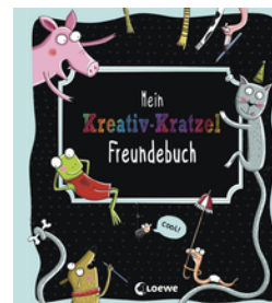
Mein Kreativ-Kratzel Freundebuch