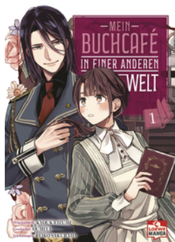
Mein Buchcafé in einer anderen Welt 01