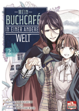
Mein Buchcafé in einer anderen Welt 02