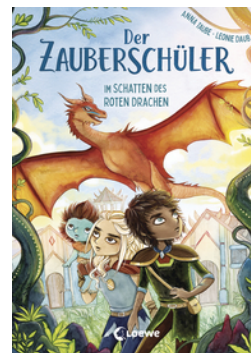
Der Zauberschüler (Band 3) - Im Schatten des roten Drachen