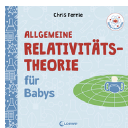
Baby-Universität - Allgemeine Relativitätstheorie für Babys