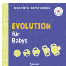
Baby-Universität - Evolution für Babys