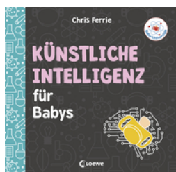
Baby-Universität - Künstliche Intelligenz für Babys