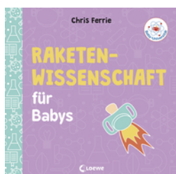
Baby-Universität - Raketenwissenschaft für Babys