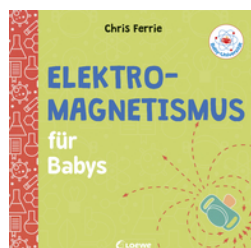
Baby-Universität - Elektromagnetismus für Babys