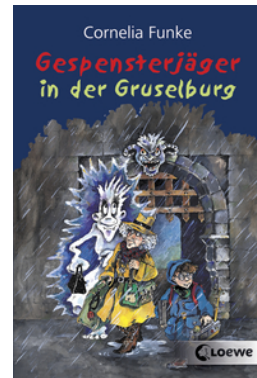
Gespensterjäger in der Gruselburg