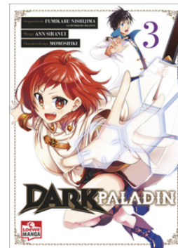
Dark Paladin 03