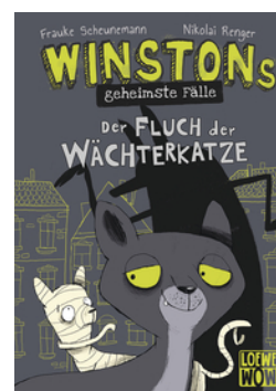
Winstons geheimste Fälle (Band 1) - Der Fluch der Wächterkatze