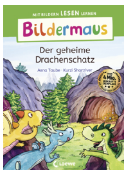
Bildermaus - Der geheime Drachenschatz