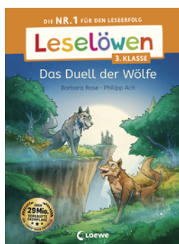
Leselöwen 3. Klasse - Das Duell der Wölfe