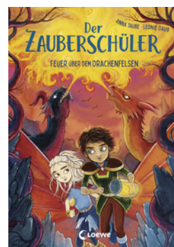
Der Zauberschüler (Band 6) - Feuer über dem Drachenfels