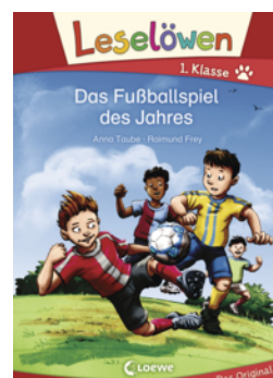
Leselöwen 1. Klasse - Das Fußballspiel des Jahres