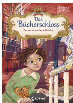
Das Bücherschloss (Band 7) - Der verwunschene Drache