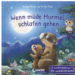
Wenn müde Marmel schlafen gehen