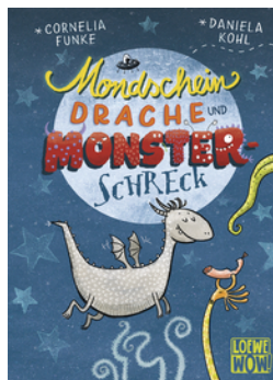
Mondscheindrache und Monsterschreck