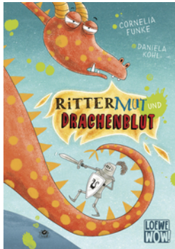
Rittermut und Drachenblut