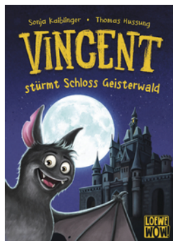
Vincent stürmt Schloss Geisterwald (Band 4)