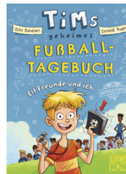
Tims geheimes Fußball-Tagebuch (Band 1) - Elf Freunde und ich!