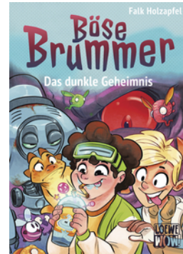
Böse Brummer (Band 2) - Das dunkle Geheimnis