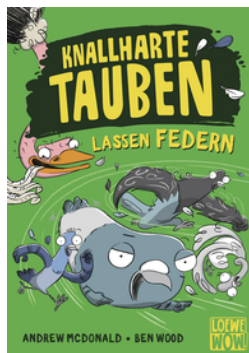
Knallharte Tauben lassen Federn (Band 2)