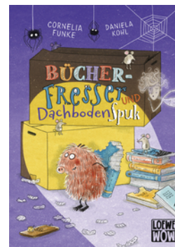
Bücherfresser und Dachbodenspuk