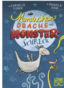
Mondscheindrache und Monsterschreck