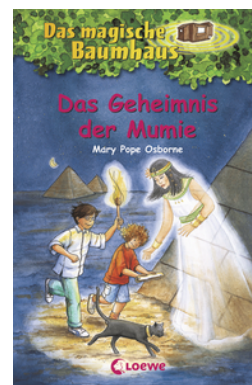
Das magische Baumhaus (Band 3) - Das Geheimnis der Mumie