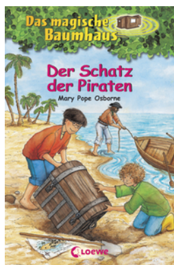
Das magische Baumhaus (Band 4) - Der Schatz der Piraten