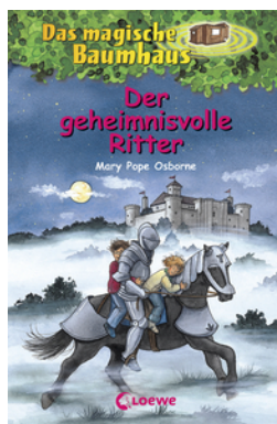
Das magische Baumhaus (Band 2) - Der geheimnisvolle Ritter