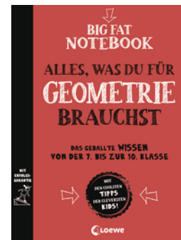
Big Fat Notebook - Alles, was du für Geometrie brauchst