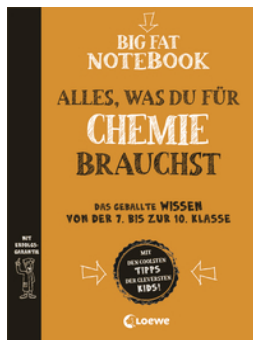
Big Fat Notebook - Alles, was du für Chemie brauchst - Das geballte Wissen von der 7. bis zur 10. Klasse