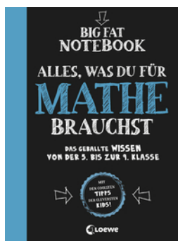
Big Fat Notebook - Alles, was du für Mathe brauchst - Das geballte Wissen von der 5. bis zur 9. Klasse