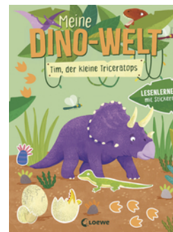
Meine Dino-Welt - Tim, der kleine Triceratops