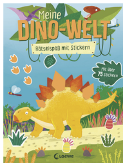
Meine Dino-Welt - Rätselspaß mit Stickern