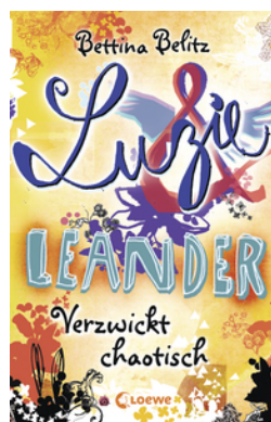
Luzie & Leander - Verzwickt chaotisch