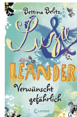
Luzie & Leander - Verwünscht gefährlich