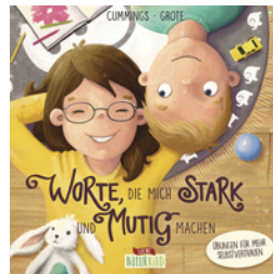
Worte, die mich stark und mutig machen