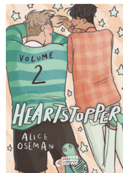
Heartstopper Volume 2 (deutsche Ausgabe)