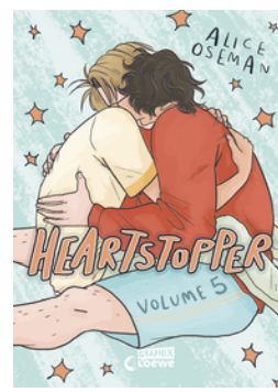
Heartstopper Volume 5 (deutsche Hardcover-Ausgabe)