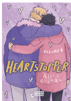
Heartstopper Volume 4 (deutsche Ausgabe)